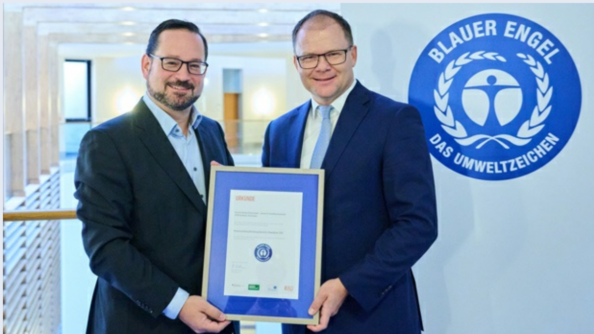
Bundesumweltminister Carsten Schneider überreichte DBU-Generalsekretär Alexander Bonde (links) die Urkunde