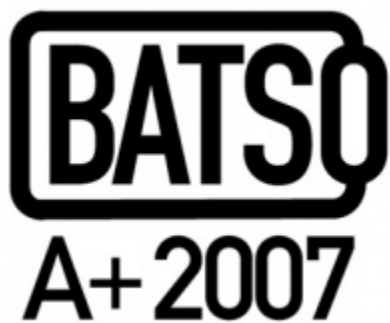
Abbildung 4 Das BATSO-Gütesiegel für die Sicherheit von Batterien 45

BATSO ist ein Kooperationsprojekt des ExtraEnergy e.V. und des ITRI Institutes, keine formal eigenständige Organisation. Der Standard wird über den im April 2011 gegründeten BATSO e.V. weiter entwickelt, verwaltet und interessierten Prüfinstituten zugänglich gemacht. Zu den Erstmitgliedern des BATSO e.V. gehören u.a. der TÜV Rheinland und das ITRI, ein staatliches Technologieforschungsinstitut aus Taiwan. (ExtraEnergy 2011)