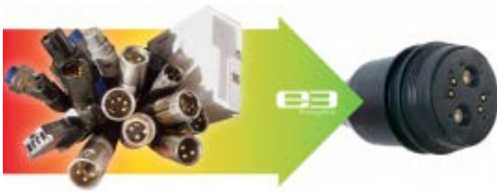
Abbildung 3: Vom Steckerdschungel zum Standard (hier: EnergyBus-Stecker)

EnergyBus (EB) 41 ist der erste und bisher einzige Standard speziell für Leicht-Elektro-Fahrzeuge (LEVs). Für die LEV Branche ist "EnergyBus" der entsprechende Standard und der "EnergyBus-Stecker" das Pendant zum "USB-Stecker". Für die Informationsübermittlung zwischen Ladegerät und Fahrzeug (hier: Pedelec) wurde der CAN-Bus 42 gewählt. Als Protokoll kommt CAN Open zum Einsatz. CAN Open ist eine Maschinensprache, die mit Open Source Systemen vergleichbar ist.