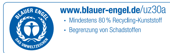
DE-UZ 30a / 5-stellige Vertragsnummer

Gemäß den Kriterien der DE-UZ 30a Punkt 3.8 Kennzeichnung des Endprodukts: Auf Fertigerzeugnissen aus Kunststofffolien (z.B. Tragetaschen, Versandtaschen) muss bei Logoaufdruck verpflichtend das Erklärfeld und die jeweils 5-stellige Vertragsnummer (UZ 30a / Vertragsnummer) abgebildet werden oder auf den Logoaufdruck verzichtet werden.