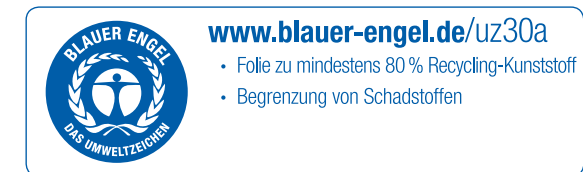
DE-UZ 30a / 5-stellige Vertragsnummer

Anwendungsbeispiele Erklärfeld für andere Produkte