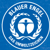
Abbildung Registriernummer (DE-UZ 14a, DE-UZ 14b, DE-UZ 30a, DE-UZ 56)

Sofern die Angabe der Registriernummer verpflichtend ist, muss sie vom Hersteller in der blauen Logofarbe und gut lesbar in unmittelbarer Nähe zum Logo auf dem Produkt platziert werden. Die entsprechende Registriernummer wird in diesen Fällen von der RAL gGmbH erteilt.