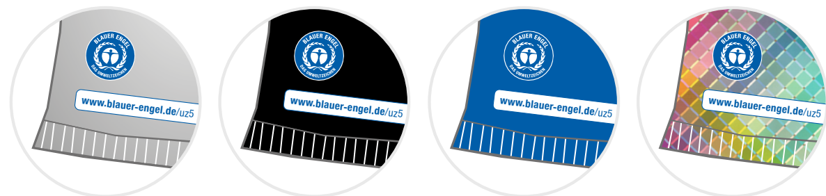
Beispiele zur Verwendung von Logo und Kurzlink auf unterschiedlichen Hintergründen

In begründeten Ausnahmen kann in Absprache mit der RAL gGmbH hiervon abgewichen werden.