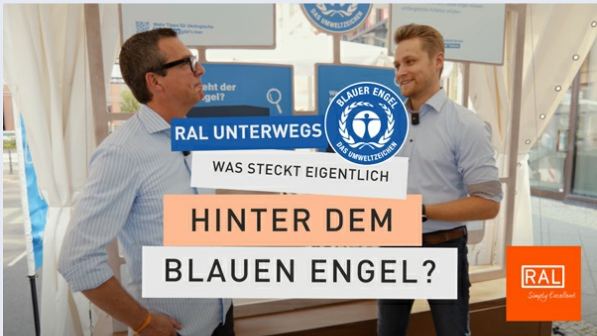
RAL unterwegs mit dem Umweltzeichen Blauer Engel