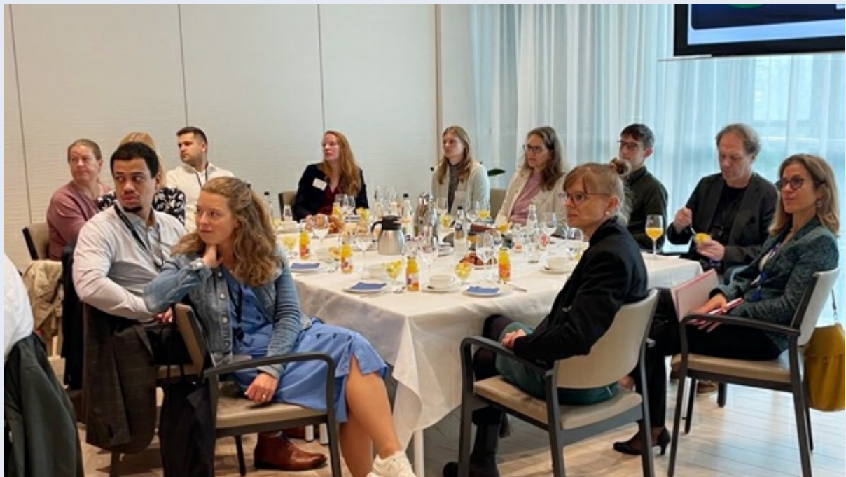
Vertreter*innen der europäischen Typ I Umweltzeichen beim Frühstück in Brüssel.